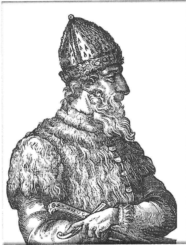
Государь Московский Иван 3