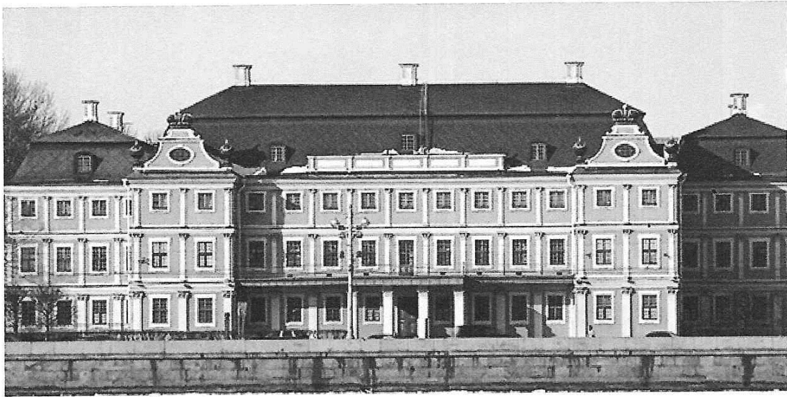
Дворец А.Д.Меншикова на Васильевском острове. Архитектор Фонтана