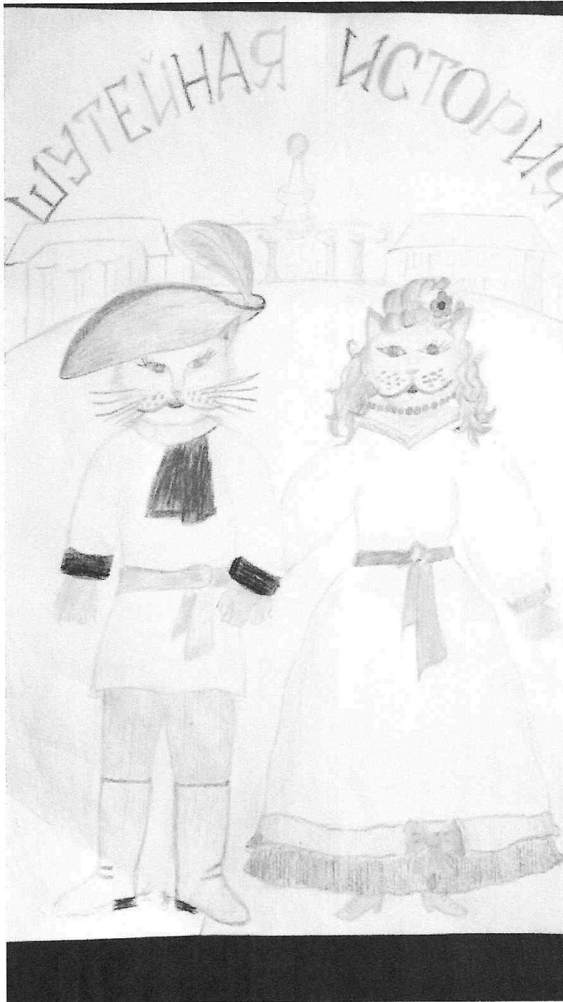
Кот Василий с супругой. Рисунок автора