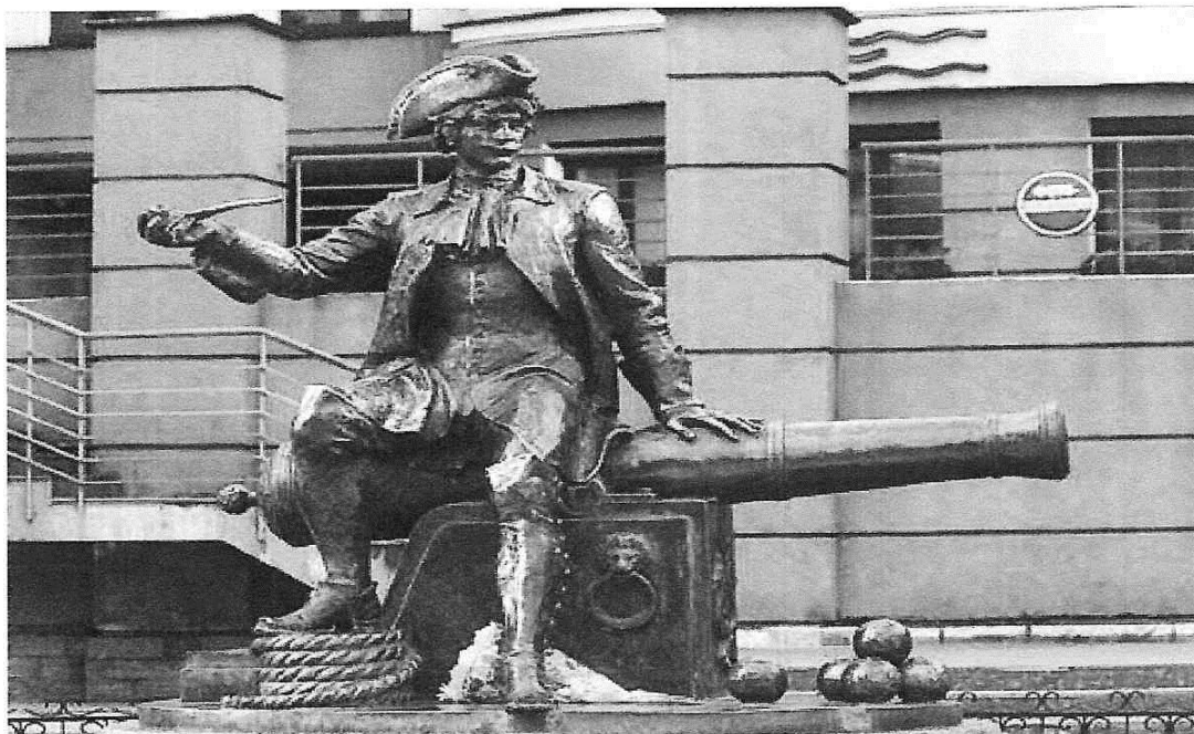
Памятник, посвящённый Василию Корчмину - герою легенды о названии Васильевского острова. Находится на 7-ой линии В.О.