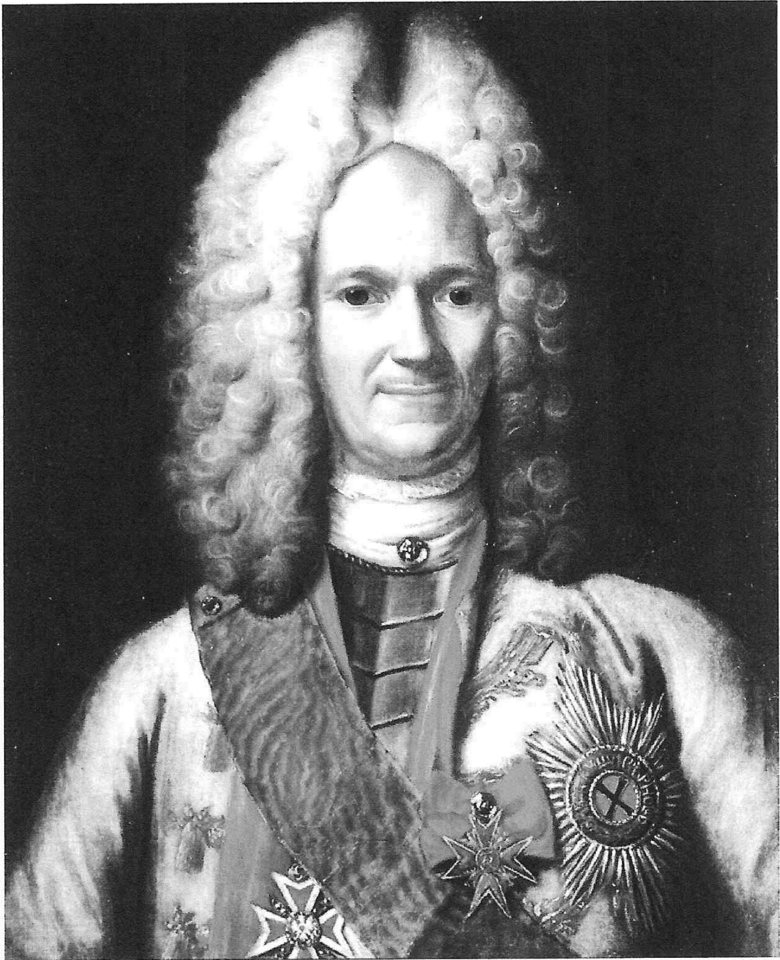
Александр Данилович Меншиков