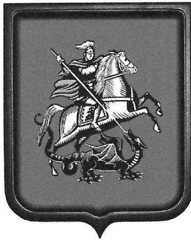
ГЕОРГИЙ-ПОБЕДОНОСЕЦ. НОВГОРОДСКАЯ ИКОНА