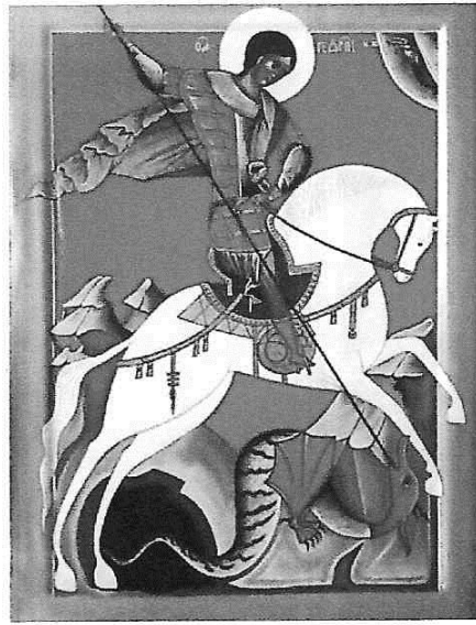
Герб города Москвы